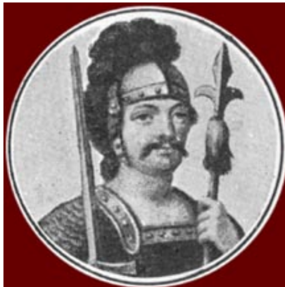
Igor Grand Prince de Kiev 878 – 945 La capitale change de lieu : elle passe de Novgorod à Kiev.