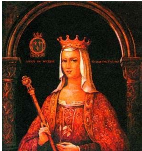
Yaroslav le Sage 978 – 1054 Grand Prince de Kiev. Sa fille, Anne (à droite), épousa Henri 1er, Roi de France 1008-1060, À la mort du Roi, elle régna de 1051 à 1059, puis devint Régente du Royaume de France de 1060 à 1066.