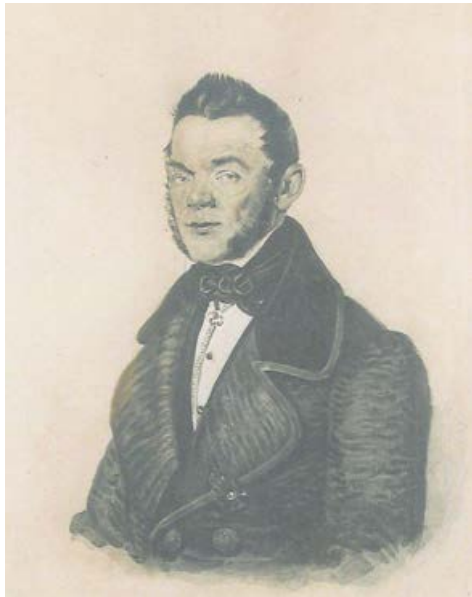
Nikita Tatistcheff 1796 – 1852