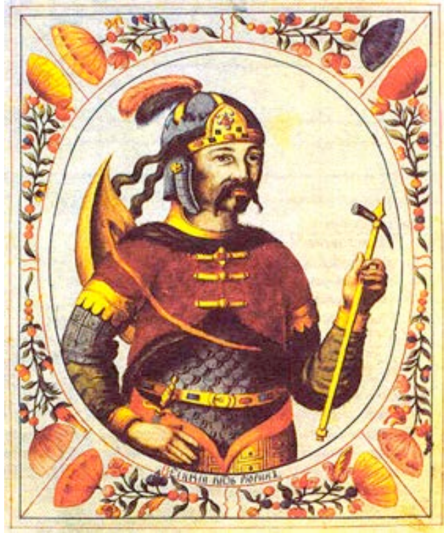
Rurik, le premier "Tsar" de Russie 830 – 879 Grand Prince de la ville de Novgorod, qu'il a fondé.