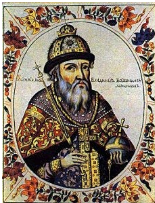
Wladimir 1 er , le Monomaque 1052 – 1125 Grand Prince de Kiev et Prince de Smolensk.