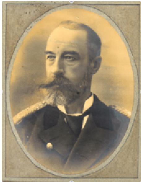
Alexis Tatistcheff 1846 – 1896