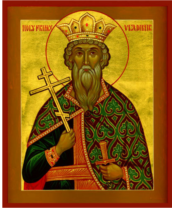
Saint Wladimir 958 – 1015 Grand Prince de Kiev. C'est lui qui a christianisé la Russie en l'an 1000.