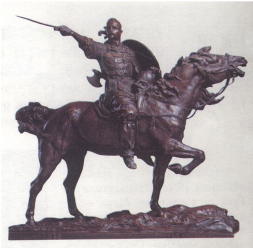
Sviatoslav 942 – 972 Grand Prince de Kiev.