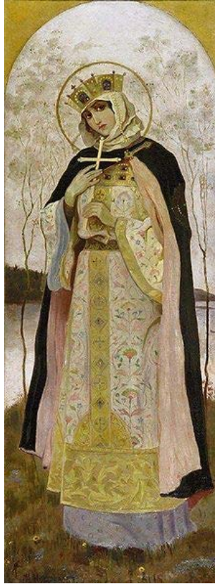
Sainte Olga 890 – 960, Régente et mère de Sviatoslav, le futur Grand Prince de Kiev .