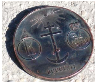
Médaille commémorative pour les 500 ans de l'apparition du nom / surnom de Tatistcheff