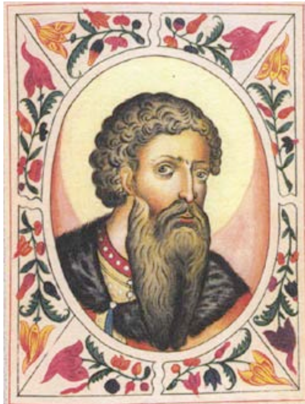
Vsevolod 1 er Grand Prince de Kiev et Prince de Périoslav 1030 — 1093