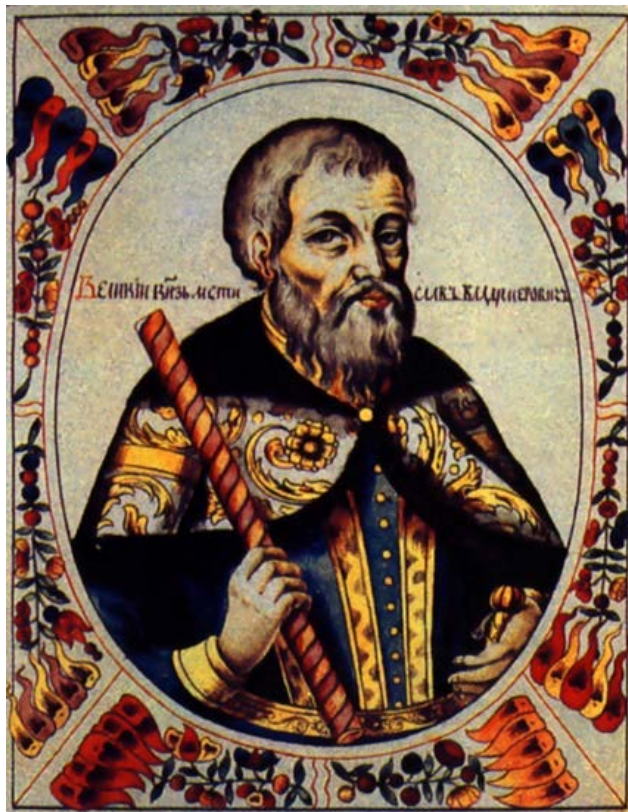
Mstislav 1 er Grand Prince de Kiev et de Novgorod 1076 – 1132.